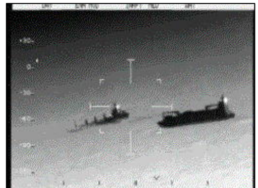
【沈みつつある貨物船（左）】

平成18年3月13日午前1時38分、パナマ籍貨物船から「久米島の北東約150kmの海上で、1番2番船倉に浸水中。危険な状態。救助を頼む。」との情報を入手。巡視船1隻、固定翼機2機、ヘリ2機、特殊救難隊1隊で対応。合わせて、航空自衛隊救難隊及び付近航行船舶にも救助協力要請。航空自衛隊ヘリが2名を吊り上げ救助。付近航行中の貨物船が残る22名全員を救助した。